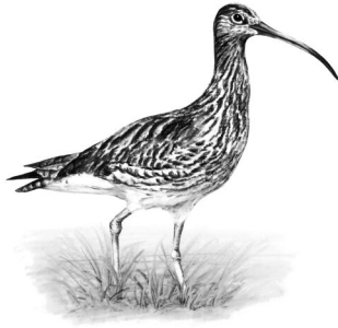
1. Großer Brachvogel