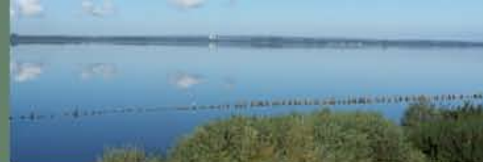
Blick auf den See

Vom Turm aus sind Haubentaucher ( Podiceps cristatus ) auf dem See zu beobachten. Sie haben am Schilfrand ein Revier besetzt, das sie gegen andere Paare verteidigen. Ihr schwimmendes Nest bauen sie gut versteckt zwischen lückig wachsende Schilfhalme. Die beiden Partner wechseln sich bei der Brut ab, ebenso beim Tragen der Küken, die die ersten Tage auf dem Rücken der Eltern verbringen. Die Bettelrufe der fast immer hungrigen Küken schallen nach ihrem Schlupf laut über den See.